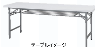
テーブルイメージ