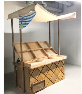
一般販売エリア ブースイメージ